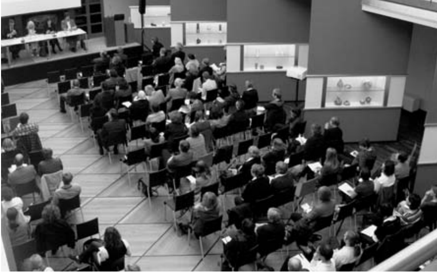
Herbst 2010: Jahrestagung von ICOM Deutschland in Leipzig.